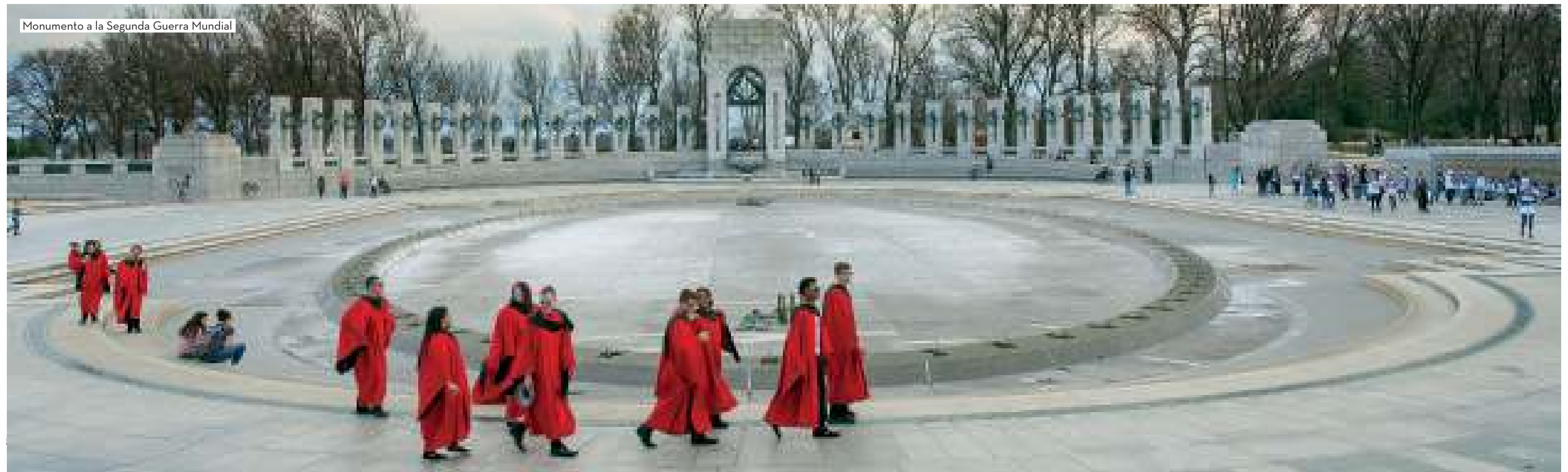
Monumento a la Segunda Guerra Mundial